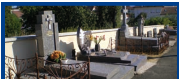
Mur du cimetière