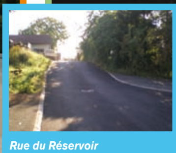
Rue du Réservoir