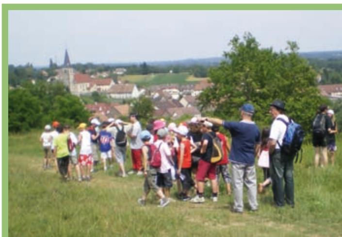
Les classes de CM1-CM2, en visite sur le chemin de découverte

Il « marque provisoirement le pas », il doit s'inscrire dans le schéma dit PDIRP (Plan Départemental des Itinéraires et Randonnées Pédestres). Le tracé de notre chemin emprunte une section du sentier de randonnée départementale N°8 (le sentier du bois de la Duchesse), le balisage doit être cohérent. Les échanges avec les responsables départementaux sont en cours, nous bénéficierons ainsi d'une aide technique et « pour quoi pas » financière.