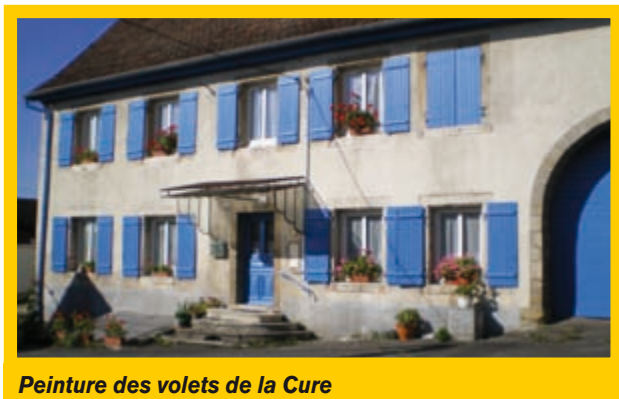
Peinture des volets de la Cure