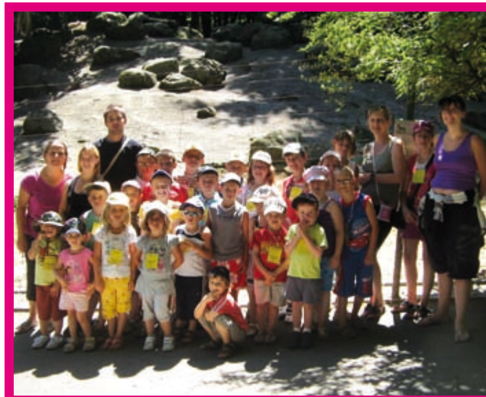
La vie au centre

Le centre de loisirs du mercredi n'a toujours pas trouvé son public. Depuis un an, la moyenne des enfants oscille entre 3 et 4 enfants. Sachant qu'un minimum de 5 agents communaux est nécessaire, l'existence même du centre de loisirs le mercredi sera à revoir d'ici fin de l'année si les effectifs n'évoluent pas. Parents, n'hésitez pas à faire bénéficier vos enfants d'activités de qualité le mercredi.