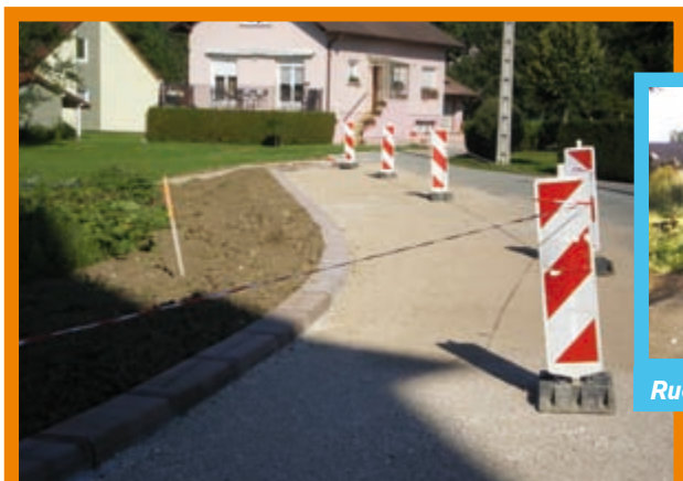
Rue du Cimetière

Au cours du premier semestre, la totalité des travaux de bâtiments et de voirie inscrit au budget a été engagée. Les chantiers seront terminés en novembre. La rénovation importante des rues du cimetière et derrière l'église a occasionné des désagréments aux riverains. Tout a été fait pour les minimiser. Ces voies sont aujourd'hui rénovées, éclairées, le « tout à l'égout » installé.